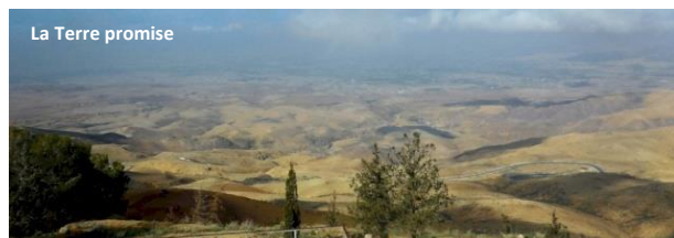
La Terre promise

Le lendemain, visite du mémorial sur le Mont Nebo où, selon la tradition biblique, Moïse est mort après avoir vu la Terre promise. Puis un arrêt à la ville de Madaba, dans laquelle deux tiers de musulmans cohabitent avec un tiers de chrétiens. La Jordanie est en effet réputée terre d'accueil des réfugiés où tous vivent dans la paix et le respect.