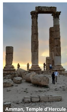
Amman, Temple d'Hercule

L'arrivée à Amman devait calmer un peu notre ardeur car des jumelles dans la valise de l'un d'entre nous ont été source de questionnement parmi les agents de la sécurité à l'aéroport. Le groupe a patienté gentiment (G...d, nous ne t'en voulons pas) et tout le monde a pu s'endormir à l'hôtel... vers 2 h du matin.