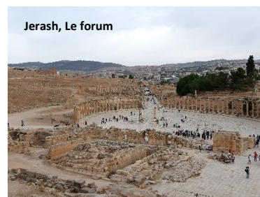
Jerash, Le forum

La première journée fut consacrée à Amman, la capitale dont la population est passée pendant ces dernières décennies de moins de 300 000 habitants à environ 1 million et demi. La citadelle que nous avons visitée juste avant le coucher du soleil, et depuis laquelle nous avons pu entendre l'appel à la prière qui retentissait dans toute la ville, nous a fortement impressionnés. Cette citadelle est au cœur de la cité antique où l'empereur Marc-Aurèle y fit construire le temple d'Hercule orné de colonnes majestueuses. Plus bas dans la ville, on a pu admirer un théâtre où sont donnés encore aujourd'hui des concerts en plein air. Nous avons poursuivi notre route vers Jerash, l'une des villes de la Jordanie qui peut s'enorgueillir d'un patrimoine archéologique considérable, en témoignent le forum, l'hippodrome et la porte de l'empereur Hadrien.